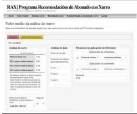
Pantallazo da páxina de entrada de datos da aplicación RAX