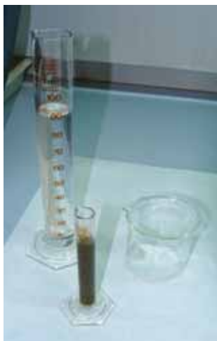
A medida da condutividade faise introducindo o electrodo no xurro diluído con auga na proporción 1:9