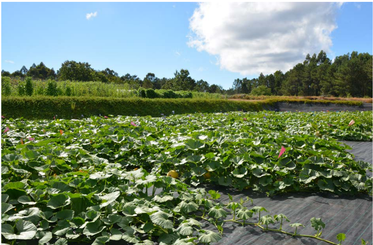
Imaxe 1: Vista xeral do campo de ensaio

Multiplicáronse 8 variedades de cabazas recollidas en prospeccións en Galicia. Para o que se plantaron 24 plantas de cada unha das variedades para asegurar un mínimo de variabilidade. Debido a que as cabazas posúen flores unisexuales con nectarios, foi necesario o illamento das flores para evitar a polinización cruzada por insectos. Aproveitando que a polinización se realizou de forma manual se mesturaron os polen de tódalas flores masculinas de cada variedade antes de cada polinización para así acadar o máximo de variabilidade no “pool xenético”. De cada unha das 24 planta se recolleran dous froitos dos que se lle extraerán as sementes.